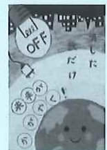
令和元年度 小学生の部 グランプリ作品