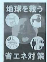
令和元年度 中学生の部 グランプリ作品